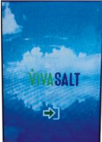
Рисунок 1: екран привітання

Шнур живлення потрібно підключити до розетки. Увімкніть пристрій, натиснувши перемикач, розташований у нижній частині пристрою поруч зі шнуром живлення — після цього з'явиться головний екран (Рисунок 1).