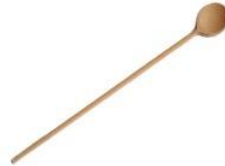
ДЕРЕВ'ЯНА КУХОННА ЛОЖКА